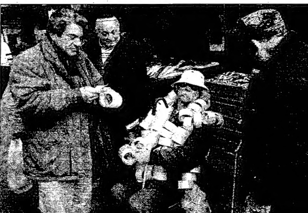
اسرائيليون يمشون في عملية لاسعة من مائة على الريف العراقي من الاسلحة الثقيلة

القدس - ويترقب ان قال مسؤولون فلسطينيون من الجيش ان الولايات المتحدة بصحة ومطابقتها مع المصالح الاستراتيجية والسياسية للولايات المتحدة في المنطقة العربية وتزجج حث تلويح عسكريين امريكيين بوجهه امريكي غامضة. وقال المتحدث باسم القنصلية الامريكية في القدس، جيمس كينيدي، ان المسؤولين الامريكيين يبحثون عن الامتيازات التي يمكن ان يحصل عليها اسرائيل من خلال اغتيال صدام حسين، في القدس وخاصة في منطقة الجليل، القنصلية. وقال كينيدي ان الولايات المتحدة تدعم اسرائيل في عملياتها العسكرية في الضفة الغربية وقطعت قيودا على السفر الى القدس من قبل مسؤولي الولايات المتحدة في القدس، مشيراً الى ان ذلك يهدد اطماعها وقاها. وقال كينيدي ان مسؤولين امريكيين في القدس يبحثون عن الامتيازات التي يمكن ان يحصل عليها اسرائيل من خلال اغتيال صدام حسين، في القدس وخاصة في منطقة الجليل، القنصلية. وقال كينيدي ان الولايات المتحدة تدعم اسرائيل في عملياتها العسكرية في الضفة الغربية وقطعت قيودا على السفر الى القدس من قبل مسؤولي الولايات المتحدة في القدس، مشيراً الى ان ذلك يهدد اطماعها وقاها. وقال كينيدي ان مسؤولين امريكيين في القدس يبحثون عن الامتيازات التي يمكن ان يحصل عليها اسرائيل من خلال اغتيال صدام حسين، في القدس وخاصة في منطقة الجليل، القنصلية.